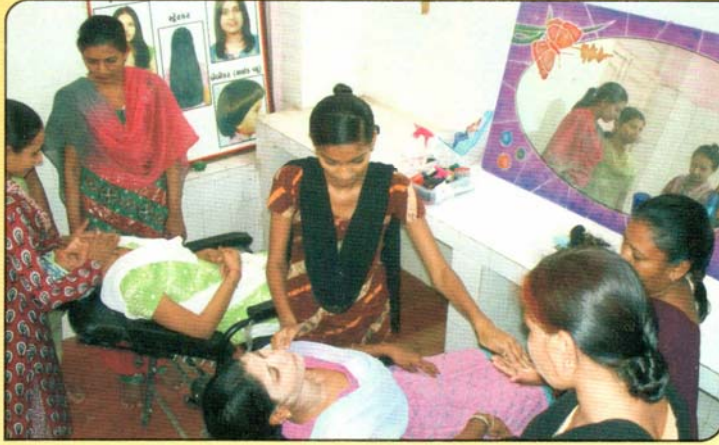
બેઝીક બ્યુટી એન્ડ હેર ડ્રેસીંગ વ્યવસાય